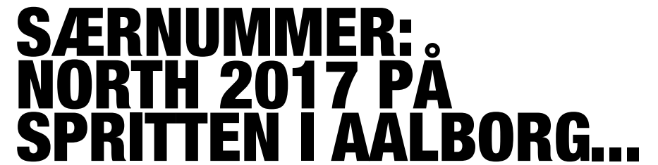
Illustration: Ole Flyv